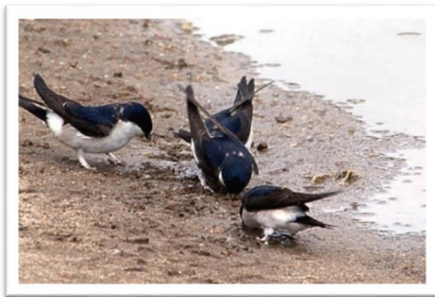
Mehlschwalben an einer Pfütze

Zum einen hilft das Anbringen von Kunstnestern oder das Aufstellen von Schwalbenhäusern. Zum anderen können lehmige Pfützen, z. B. im Hof oder im Garten, angelegt werden, damit den Schwalben Baumaterial zur Verfügung steht.