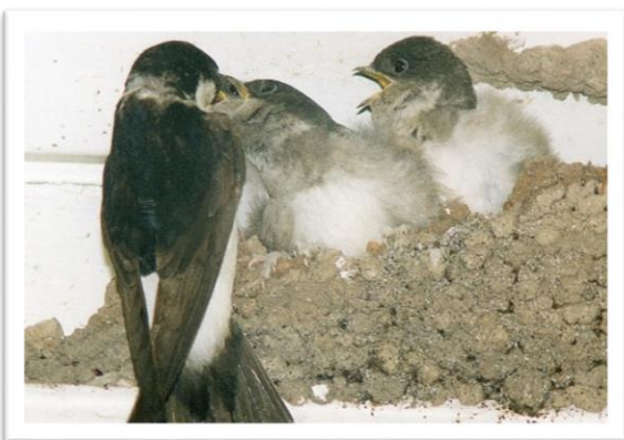
Mehlschwalbe beim Füttern der Jungvögel

Die Mehlschwalbe gehört zu den Zugvögeln, weshalb sie sich nicht das 12 Monate lang in einem Gebiet aufhält. Die Brutgebiete reichen von Spanien bis nach China. Hier brütet die Mehlschwalbe und zieht ihren Nachwuchs groß. Wird es im Herbst kälter, fehlt der Mehlschwalbe die Nahrung und sie fliegt in ihre Überwinterungsgebiete, welche sich im Süden Afrikas befinden. Um diese zu erreichen, fliegen Mehlschwalben unglaubliche 10.000 km. Im Frühling kehrt sie dann in ihr Brutgebiet zurück.