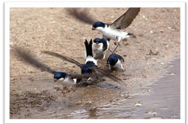
Fliegende Mehlschwalben an einer Pfütze

Doch obwohl die Mehlschwalbe weit verbreitet ist, gehört sie zu den bedrohten Arten und ihre Bestände sinken kontinuierlich. In Berlin ist der Bestand der Mehlschwalbe in den letzten 20 Jahren um ca. ein Drittel zurückgegangen ( Quelle: Mehlschwalbe - NABU Berlin ). Das liegt vor allem daran, dass vielerorts das Baumaterial für ihre Nester knapp wird. Mehlschwalben nutzen Lehmklümpchen und feuchte Erde als Nestmaterial. Für ihre Ansiedlung benötigen sie also nahegelegene Gewässerufer, lehmige Pfützen und offene Bodenstellen. Die Versiegelung der Landschaft, das Trockenlegen von Gebieten und der dramatische Wassermangel in Kleingewässern sorgen dafür, dass die Mehlschwalbe nicht genug Baumaterial für ihr Nest findet. Und ohne Nest kann die Mehlschwalbe nicht brüten.