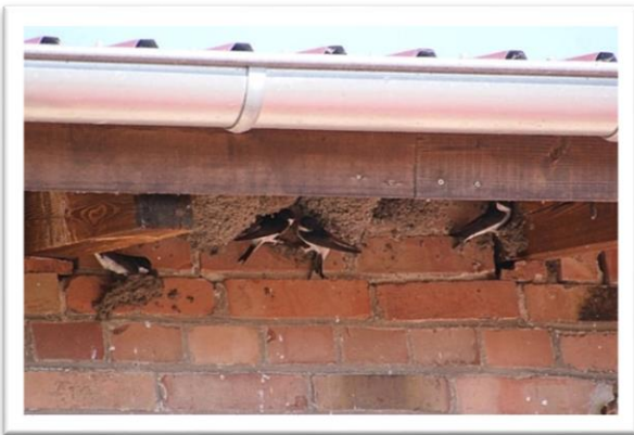
Mehlschwalbennester am Dachüberstand

Die Mehlschwalbe gehört mit der Rauchschwalbe zu den am häufigsten vorkommenden Schwalbenarten in Europa. Sie kommt in nahezu allen Formen menschlicher Siedlungen vor und bevorzugt die Nähe zu Gewässern. Mehlschwalben brüten an Gebäuden, wie z. B. unter Dachtraufen, in Fensterlaibungen oder in Balkonecken. Ebenso findet man ihre Nester auch an Brücken oder Leuchttürmen. Mehlschwalben brüten zwei- bis dreimal pro Jahr und bevorzugt in Kolonien.