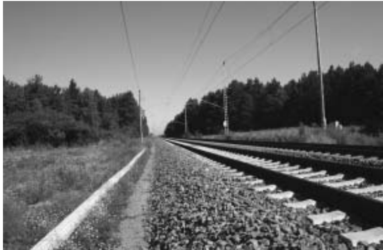
Abb. 3: Ansicht des Projektes NL im Jahr der Aussetzung der Zauneidechsen (1 Jahr nach Beendigung der Baumaßnahmen).

View of the project NL in the year of re-establishment of sand lizards (1 year after finishing of constructions).