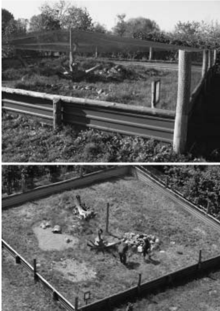
Abb. 1 und 2: Ansichten des jetzigen Freilandterrariums auf dem Gelände der Naturschutzstation Berlin-Malchow.

Views of the new outdoor enclosure at the site of the Naturschutzstation Berlin-Malchow.